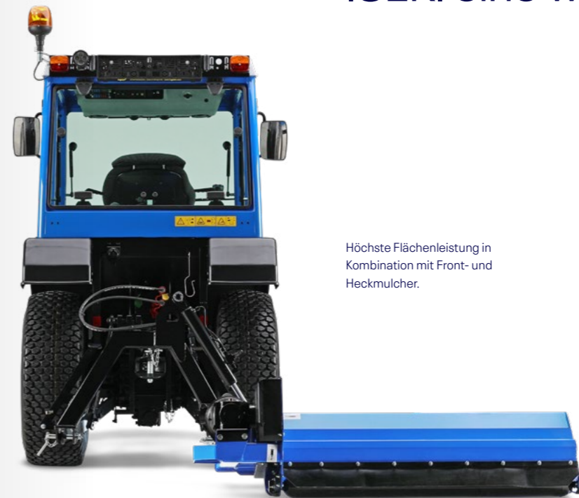
Höchste Flächenleistung in Kombination mit Front- und Heckmulcher.

Hinterlassenschaften Nicht nur beim Mulchen, auch sonst spielt das Thema Nachhaltigkeit für ISEKI eine wichtige Rolle.