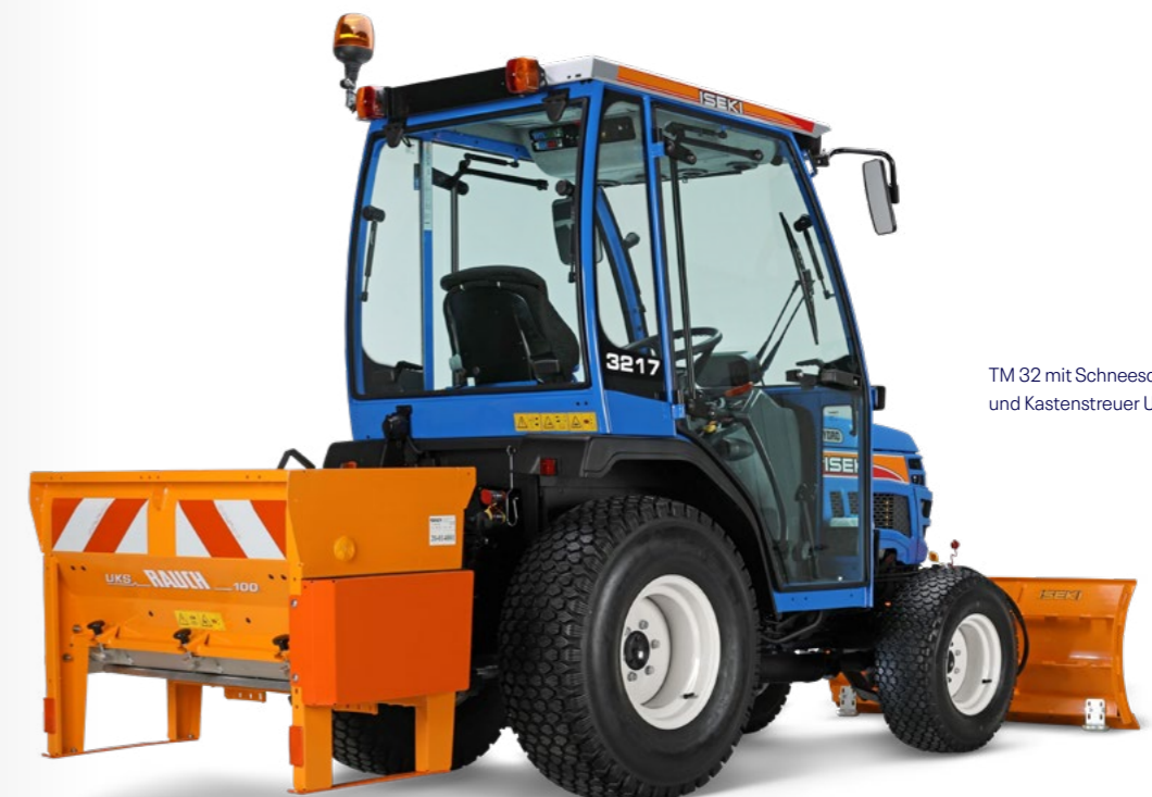
TM 32 mit Schneeschild RSM 130 und Kastenstreuer UKS 100